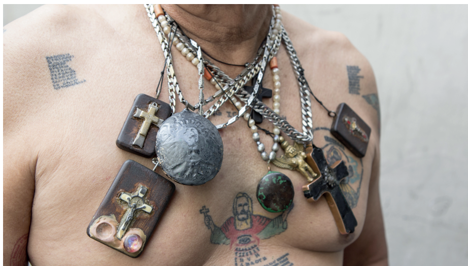
© Dino Dimar, Visual Artist, Manila, Philippines

Talismans ancestraux originaires des Philippines, les Anting-Anting jouent un rôle clef dans la culture et les traditions populaires de l'archipel. À la fois objets physiques et vecteurs d'une mémoire collective, ces talismans reflètent l'histoire et les influences qui ont façonné ces îles et leurs habitants. Le musée du quai Branly – Jacques Chirac présente, au sein de cette installation, une large sélection d'amulettes.